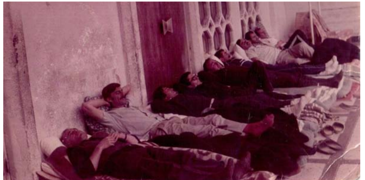
У входа во Дворец культуры, где объявили сухую голодовку гагрцы-гаграа. Сентябрь 1989 года.

В городе Гудауте 18 сентября 1989 года состоялось расширенное собрание актива района совместно с руководителями Абхазии, с представителями Народного форума Абхазии «Айдгылара» и Республиканского забастовочного комитета. Была послана телеграмма в Москву на имя Генерального Прокурора СССР А.Я. Сухарева с просьбой о взятии в своё производство всех уголовно-следственных дел по июльским событиям в Абхазии